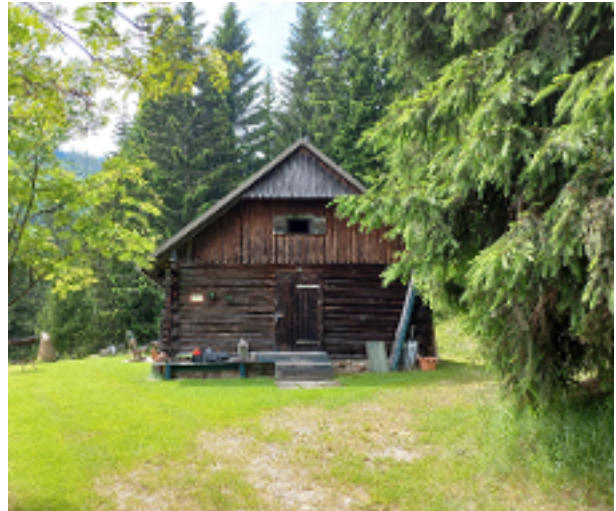
Forst und Jagdrevier im Bezirk Hollnburg